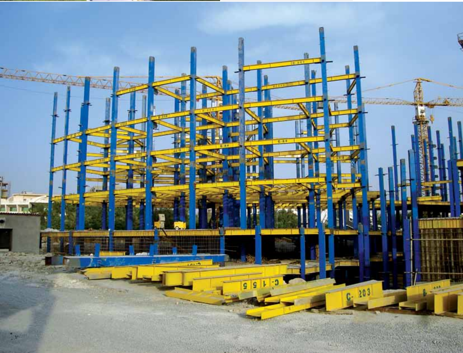
• پروژه مجتمع تجاری، اداری، مسکونی دیلمات کیش