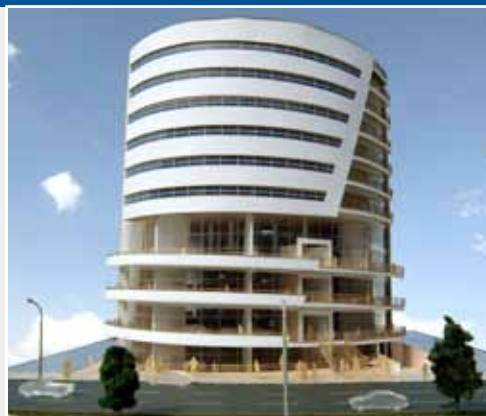
• پروژه مجتمع تجاری ، خدماتی بلوار تبریز